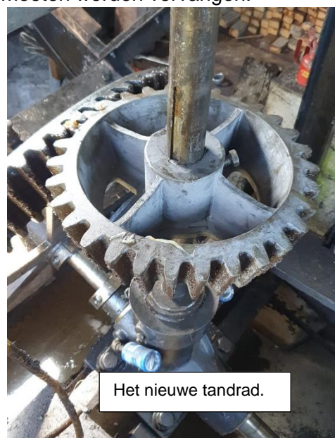
Het nieuwe tandrad.

Bij controle bleek de slijtage aan het grote en kleine tandrad dusdanig groot dat ingrijpen noodzakelijk was. Ook bleek één lager versleten. Deze klus is opgedragen aan Mannen van Staal uit Leeuwarden. Zij hebben het grote tandrad hersteld en het kleine nagemaakt.